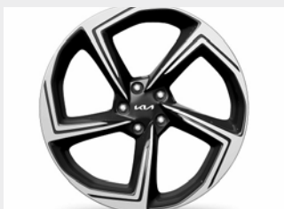
Cerchi in lega da 21"