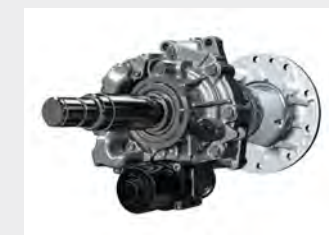
Differenziale a gestione elettronica dello slittamento