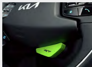
Drive Mode Select con modalità "GT"