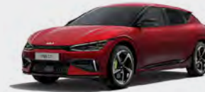
Runaway Red (CR5)