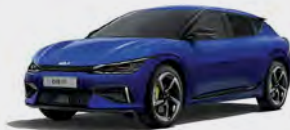
Yacht Blue (DU3)