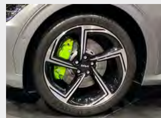
Dischi freno anteriori da 380mm con pinze colore Neon