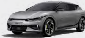
Moonscape Matte (KLM)