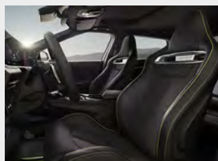
Sedili sportivi a guscio in tessuto scamosciato