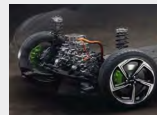
Sospensioni a controllo elettronico